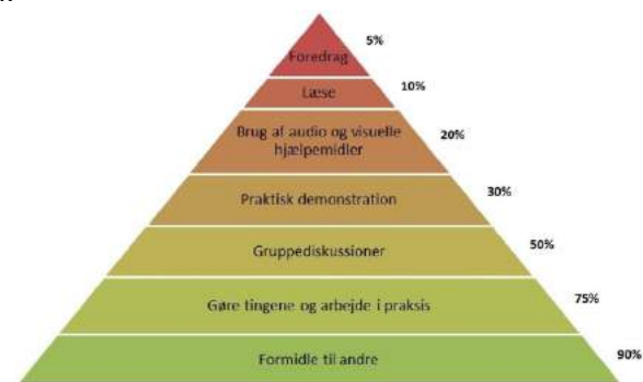
Figur 1: Læringspyramiden (EMU.dk)